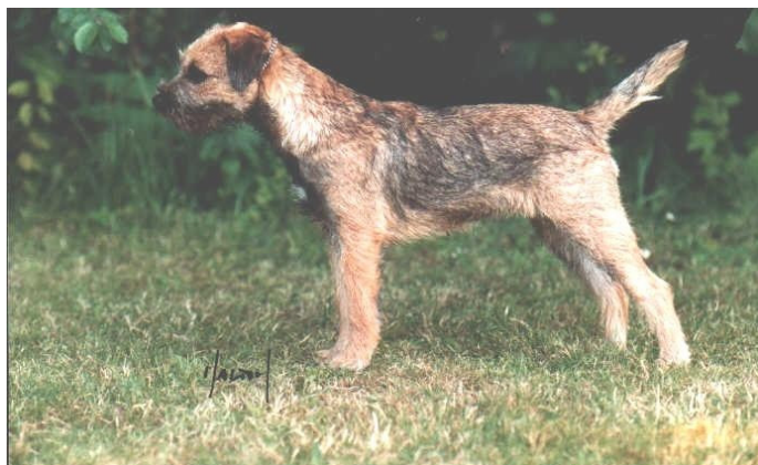
Borderhouse Imperial Jade