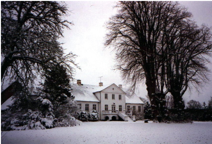
Arnakke i vinterklæder