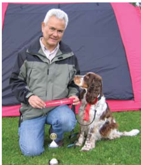
DKK's internationale lydighedsprøver i Brøndby 15. september 2007, 1. pr. 1. v. i LP2

Der er meget højere krav til præcision i lydighed end i dressur. Så det krævede en del træning før vi april 2007 fik 1. pr. i LP1. September 2007 fik vi 1. pr. i LP2 og næste mål var så LP3.