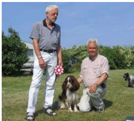
Region 2's skue 25. juni 2006, prøvевinder i dressur 2