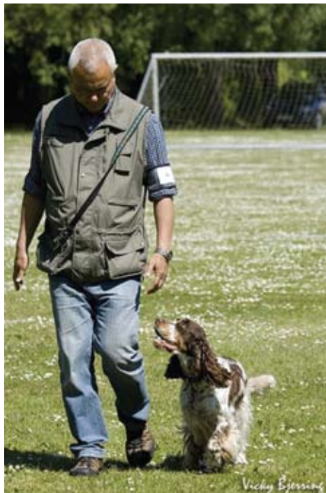
Dansk Collie Klubs lydighedsprøver ved Rishøj Hallen i Køge 25. maj 2008 1. pr. 3. v.

I maj 2008 fik Megan sin første 1. pr. i LP3, juni 2008 den anden.